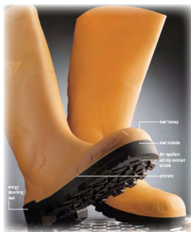
รูปที่ 1 ชิ้นส่วนของรองเท้าบูท

การผลิตรองเท้าบูทแบบนี้จะใช้แรงงานคนในการประกอบชิ้นส่วนรองเท้า โดยเริ่มจากการนำยางแผ่นที่ได้จากการบดผสมแล้วอัดรีดเป็นแผ่น ประกอบไปด้วยชิ้นส่วนที่เป็นยางและชิ้นส่วนที่เป็นผ้าเคลือบยาง (rubberised fabric component part) ตัดชิ้นส่วนต่างๆ ตามแบบ (ดังแสดงในรูปที่ 1) นำชิ้นส่วนต่างๆ มาประกอบกันโดยเริ่มจากการนำยางส่วนบน (upper) มาติดกับพิมพ์รองเท้าบูท แล้วติดพื้นรองเท้าเข้ากับส่วนบน จากนั้นนำมาอบภายใต้อากาศร้อน (hot air cure) และความดันในหม้อนึ่งอัดไอ (autocave) เวลาและอุณหภูมิที่ใช้จะขึ้นกับชนิดของรองเท้า โดยทั่วไปอุณหภูมิที่ใช้ในการอบประมาณ 120-130°C เวลา 50-90 นาที และความดันอากาศ 3-3.5 atm