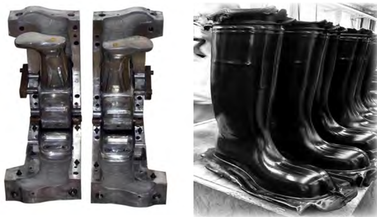
รูปที่ 4 ตัวอย่างแม่พิมพ์แบบอัดและชิ้นงานรองเท้าบูทที่ยังไม่ผ่านการตกแต่งชิ้นงาน